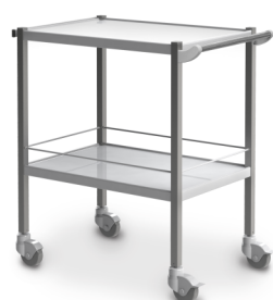
СМ-К-01 (нержавеющая сталь) 503.001