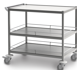
СМ-К-07 (нержавеющая сталь) 503.211

Габариты (д/ш/в): 1040x700x805 мм Колеса Ø 100 мм