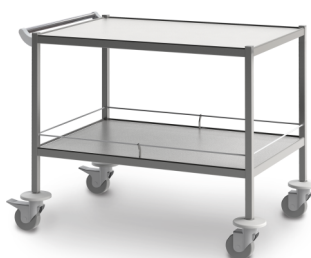
СМ-К-05 (нержавеющая сталь) 503.021

Габариты (д/ш/в): 720x460x905 мм Колеса Ø 80 мм