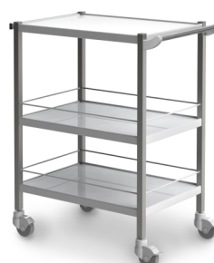
СМ-К-03 (нержавеющая сталь) 503.011

Габариты (д/ш/в): 720x460x805 мм Колеса Ø 80 мм