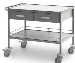
СМ-К-06 (нержавеющая сталь) 503.022

Габариты (д/ш/в): 1040x700x805 мм Колеса Ø 100 мм