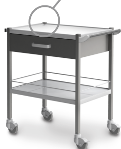
СМ-К-02 (нержавеющая сталь) 503.002

Габариты (д/ш/в): 720x460x805 мм Колеса Ø 80 мм