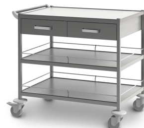
СМ-К-08 (нержавеющая сталь) 503.212

Габариты (д/ш/в): 1040x700x905 мм Колеса Ø 100 мм