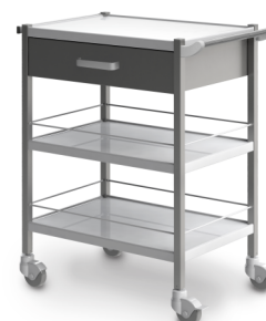
СМ-К-04 (нержавеющая сталь) 503.012

Габариты (д/ш/в): 720x460x905 мм Колеса Ø 80 мм